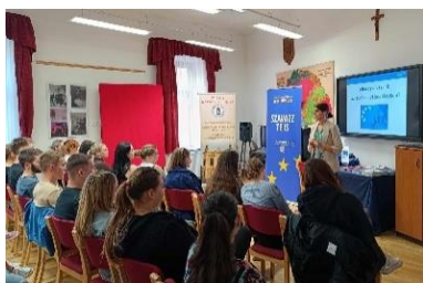
Interaktív óra az Európai Választásokról