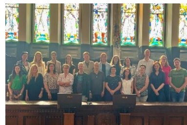
Europe Direct országos találkozó