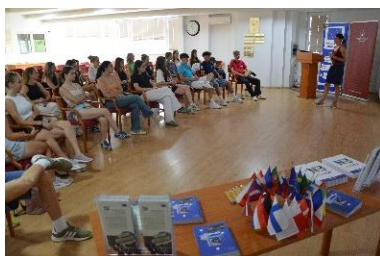
Pályaorientáció az EU-ban tematikus óra