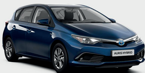
AURIS HYBRID MINIMUM 1.000.000 Ft KEDVEZMÉNNYEL*