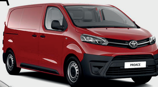
PROACE MODELLEK MINIMUM 1.200.000 Ft KEDVEZMÉNNYEL, 5 ÉV GARANCIÁVAL*