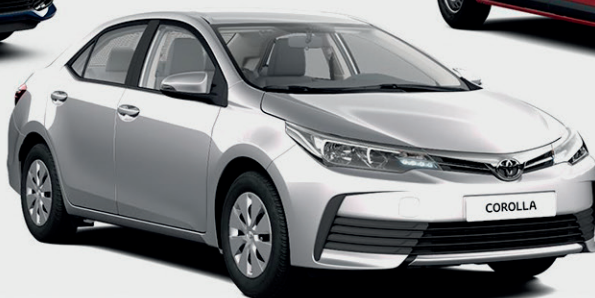
COROLLA MINIMUM 800.000 Ft KEDVEZMÉNNYEL*