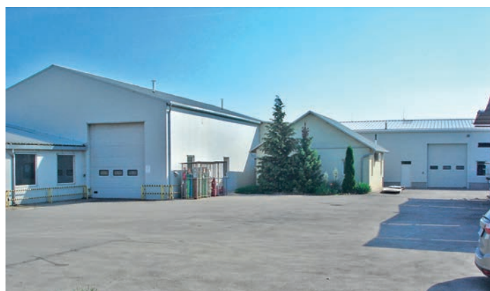
A MetalTec 2001 Kft. Ősi legnagyobb foglalkoztatója

Ma már szerencsére több lábon áll a társaság, szögezte le az ügyvezető. Alaptevékenységük továbbra is a fémmegmunkálás. A járműipar súlya mindössze húsz százalék. Emellett fűnyíróalkatrészeket, víztisztító berendezé-