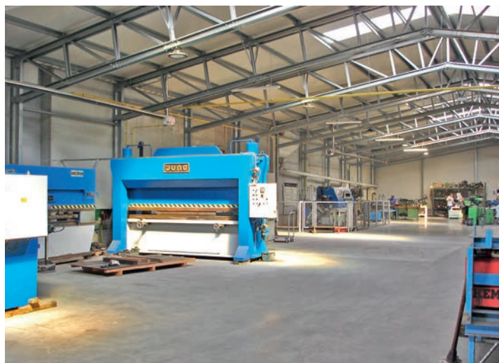
Az új csarnokban új technológia bevezetését tervezik

Beszélt arról is, hogy egy éven belül új technológiát szeretnének meghonosítani a vállalatnál. Ennek az előkészületei már megtörténtek. Mivel a telephelyük 15,5 ezer négyzetméter, a továbbiakban igények alapján bármilyen beruházásra hajlandóak, ami előbbre juttatja a társaságot. A kilátásaik perspektivikusak, 2017-ben az előző évhez képest 50 százalékkal növekedett az árbevételük, idén is több mint 40 százalékos bővülést várnak.