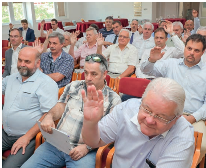
A küldöttgyűlésen egyhangú döntések születtek

um támogatásával 2017-ben is négy szakmában folytatták a mesterek képzését. Pályaorientációs feladataik keretében sikeresen szólították meg és motiválták az általános iskolás tanulókat, a számukra rendezett események (gyárlátogatások, szakmát népszerűsítő rendezvények) nagy sikerrel zajlottak.