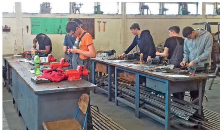
A VSZC Jendrassik-Venesz Szakgimnáziuma és Szakközépiskolájának karosszérialakatos tanulói valamennyien sikeres vizsgát tettek

Mindez nagy jelentőséggel bír, hiszen a sikeres szintvizsga a feltétele annak, hogy a tanulók megkezdhesék gyakorlatukat külső képzőhelyen. A gyakorlati képzőhelyek szívesen fogadják a tanulókat, és vizsga után rendszerint marasztalják is őket. Szinte minden szakmában hiány van a munkaerőpiacon.